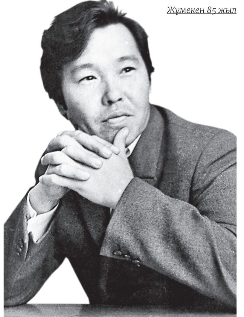
Жүмекен 85 жыл

Жүмекен үшін «бүгінгі күн» тілінде сөйлеу тәсілі – осы, «қиындыққа жорық» жасау. Қазақ поэзиясында ешқашан болмаған оқиғаға құрылған балладаға сай келетін ойлы өлең жазу. Ақынның мұндай өлеңдерін түсінудің жалғыз шарты – сыртқы сөз, оқиға желісіне қарап пікір білдіруге